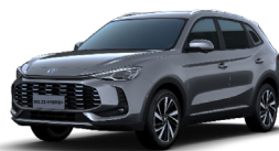
● Hampstead Grey (option à 650€ (1) )