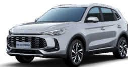
● Cosmic Silver (option à 650€ (1) )