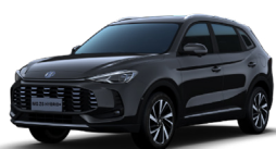
● Pebble Black (option à 650€ (1) )