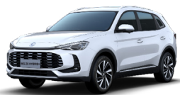
○ Dover White (de série)