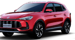
● Diamond Red (option à 650€ (1) )