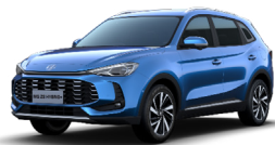
● Como Blue (option à 650€ (1) )