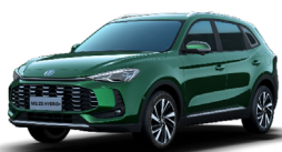
● Emerald Green (option à 650€ (1) )